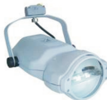
Халогенна лампа 150 watt