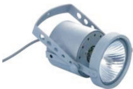
Лампа 100 watt