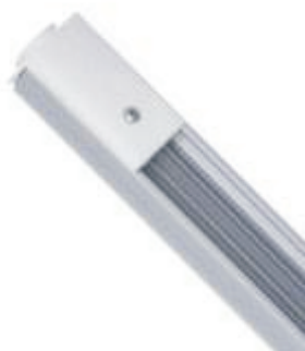
Кабелопровод за лампа