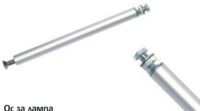
Ос за лампа